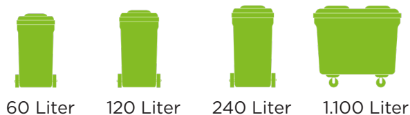
60 Liter 120 Liter 240 Liter 1.100 Liter